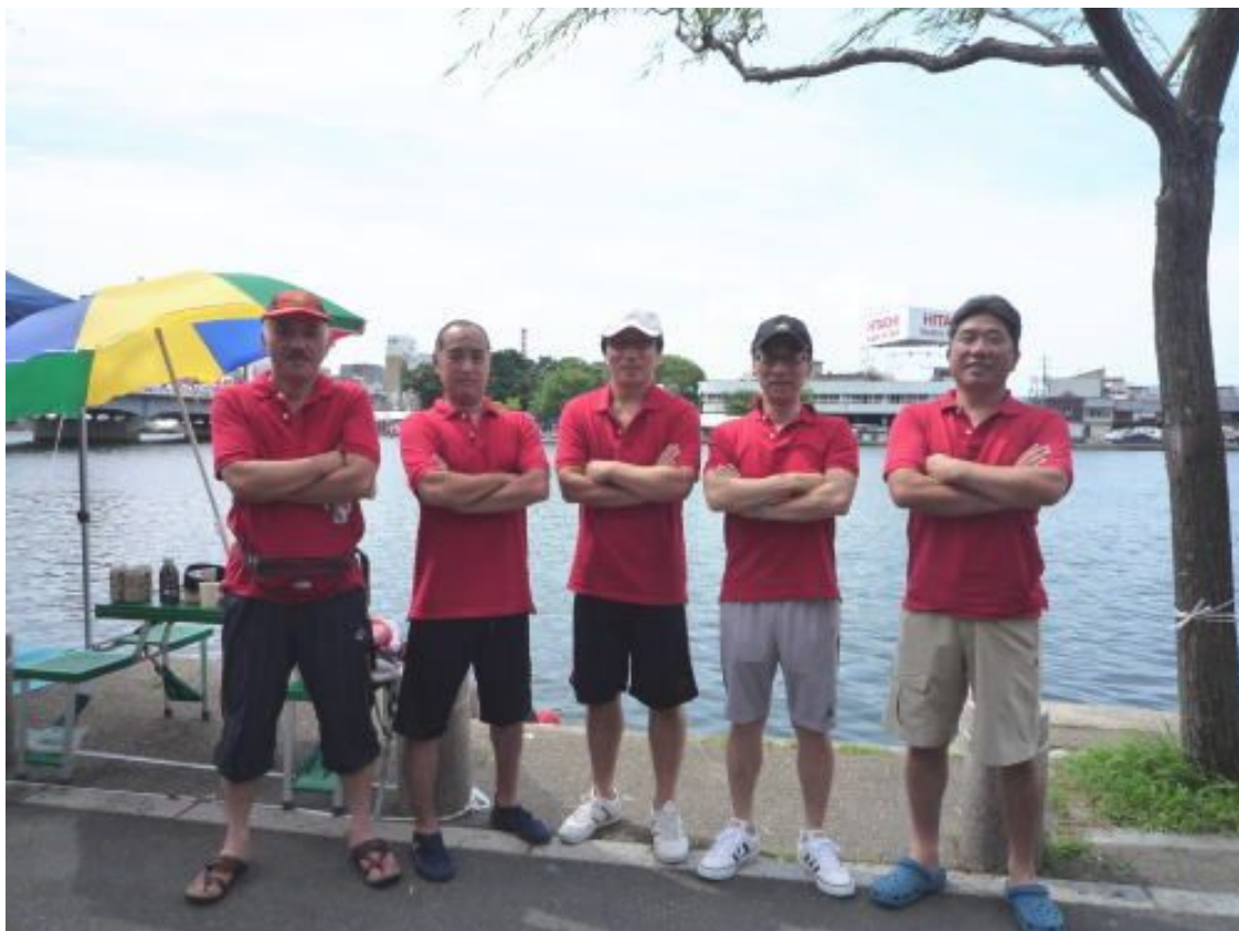
会場の大橋川河畔にて

7月24日、25日に第27回松江市民レガッタが大橋川を舞台に開催され、島根県代協からも松江支部を中心に5名が参加し計275のクルーが熱戦を展開しました。島根県代協チームは第1日目の予選1組に参加しました。